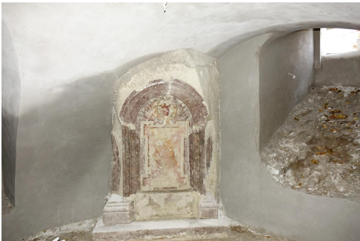
Zdjęcie 15. Krypta znajdująca się pod kaplicą św. Anny – pozostałość po kościele klasztorным w Kątach Starych.