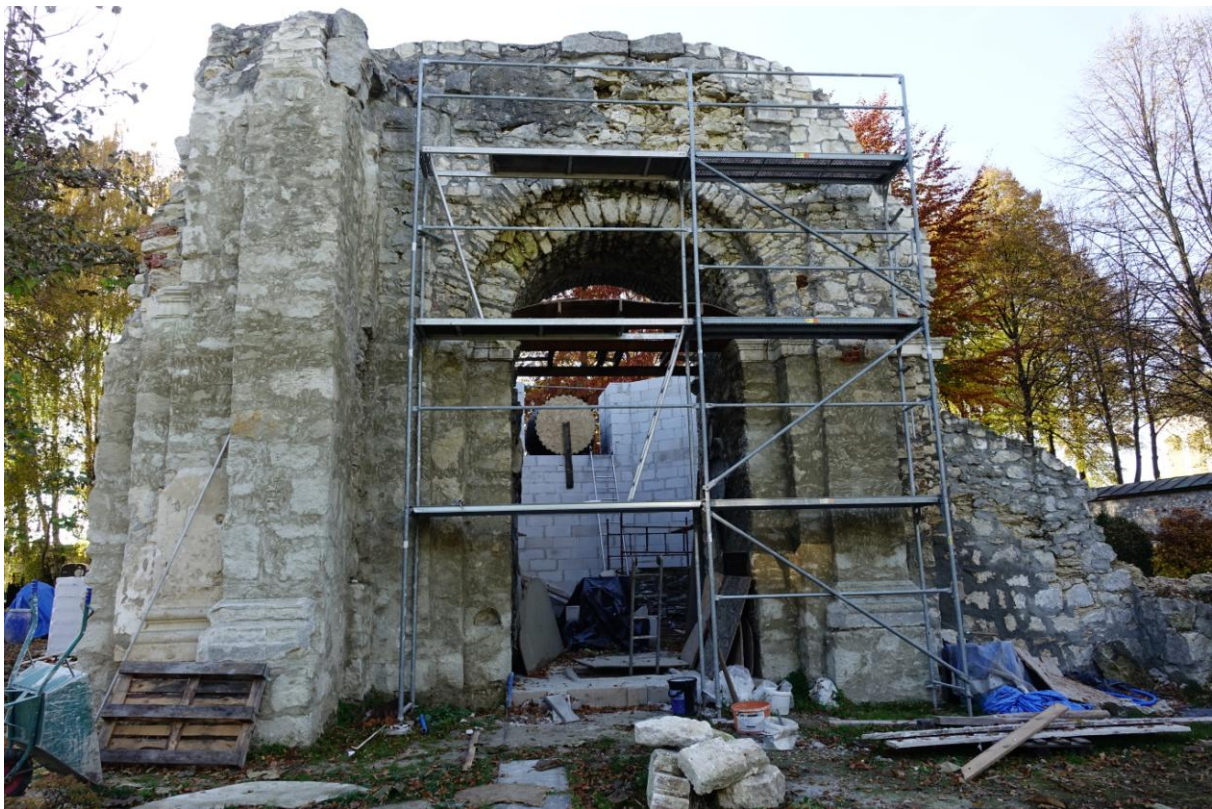
Zdjęcie 14. Odbudowa kaplicy św. Anny - pozostałość po kościele klasztornym w Kątach Starych..

16) Zespół klasztorny Księży Sercanów (dawniej oo. Reformatów) w Kątach Starych – wpisany pod numerem A.73/1-4 z 16.10.1956 i z 23.06.1967. Ufundowany przez Krzysztofa i Zofię Ossolińskich, wybudowany w 1639 r. Ojcowie reformaci zostali wprowadzeni do klasztoru w 1648 r. W 1672 r. w jego murach pochowano matkę Jana Chryzostoma Paska. Prawdopodobnie sam Jan Chryzostom Pasek spoczął tu w 1701 r. Kościół klasztorny został niemal doszczętnie zniszczony przez Niemców w dniu 7 listopada 1944 r. Niestety nie odbudowano dawnego kościoła pod wezwaniem św. Marii Magdaleny i Franciszka. Zachowały się z niego fragmenty murów przejścia z nawy do kaplicy św. Anny, pozostałości piwnic i resztki fasady. Obecnie podejmowane są działania w celu odbudowania kaplicy bocznej św. Anny z dawnego kościoła klasztornego. Istniejący kościół powstał po przebudowaniu jednego ze skrzydeł klasztornych. Do wnętrza zespołu prowadzi barokowa brama. Na murze dziedzińca umieszczono epitafium ze zniszczonego kościoła. W 1979 r. klasztor został przekazany księżom Sercanom.