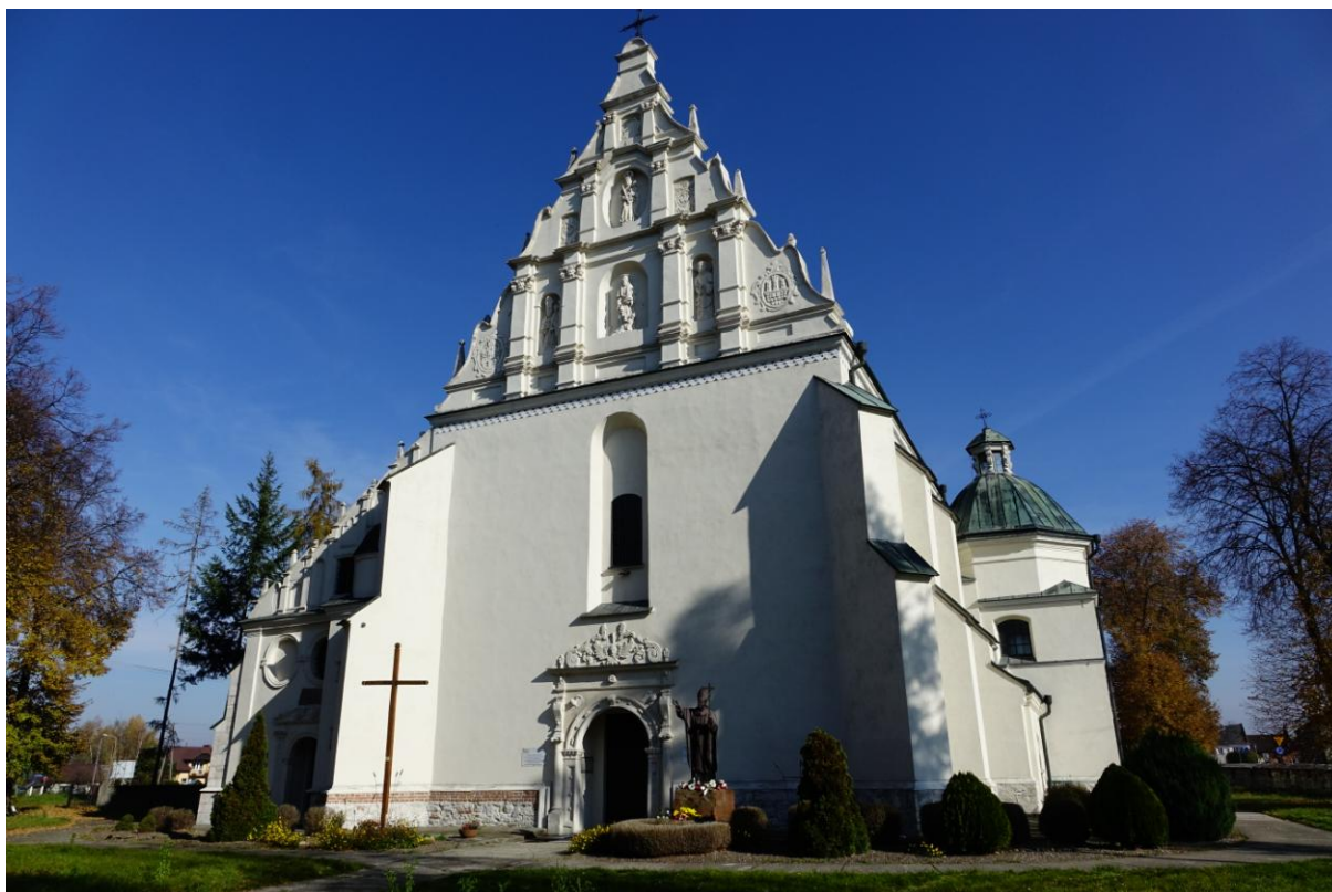
Zdjęcie 6. Kościół pw. św. Świętej Trójcy w Nowym Korczynie.