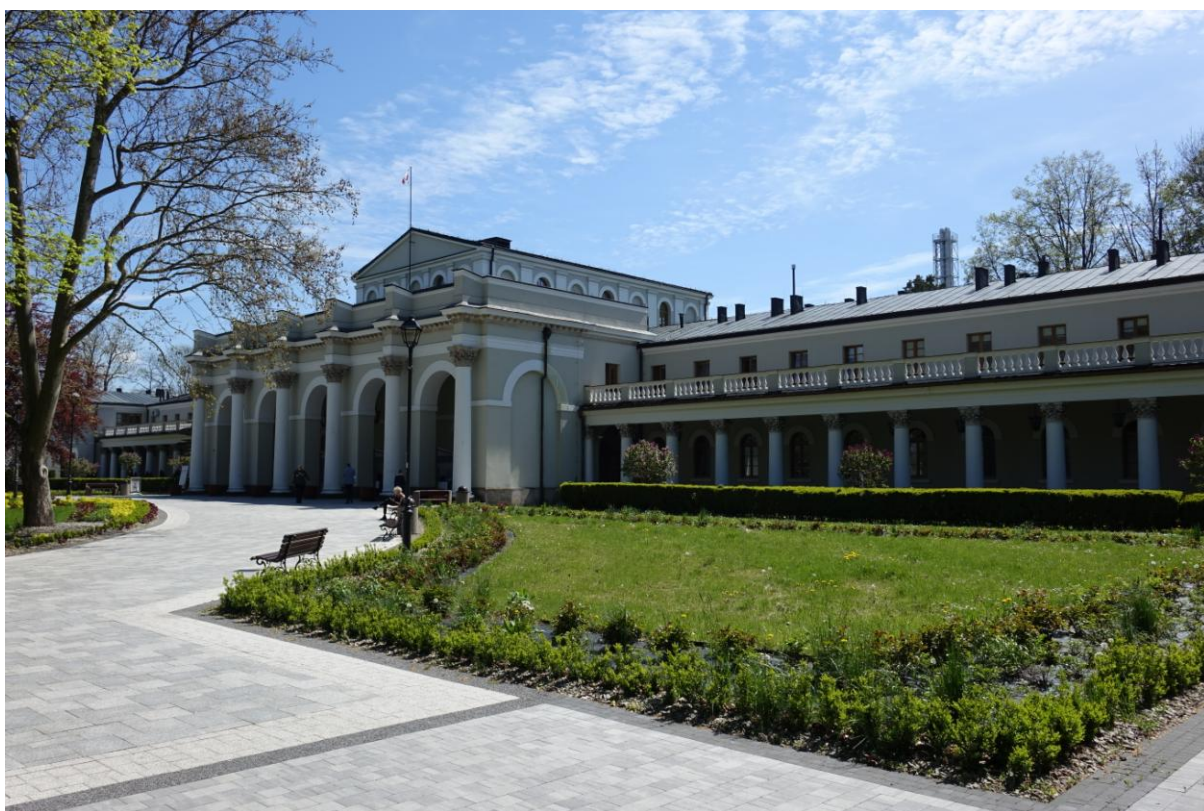
Zdjęcie 20. Sanatorium „Marconi” w Busku - Zdroju.