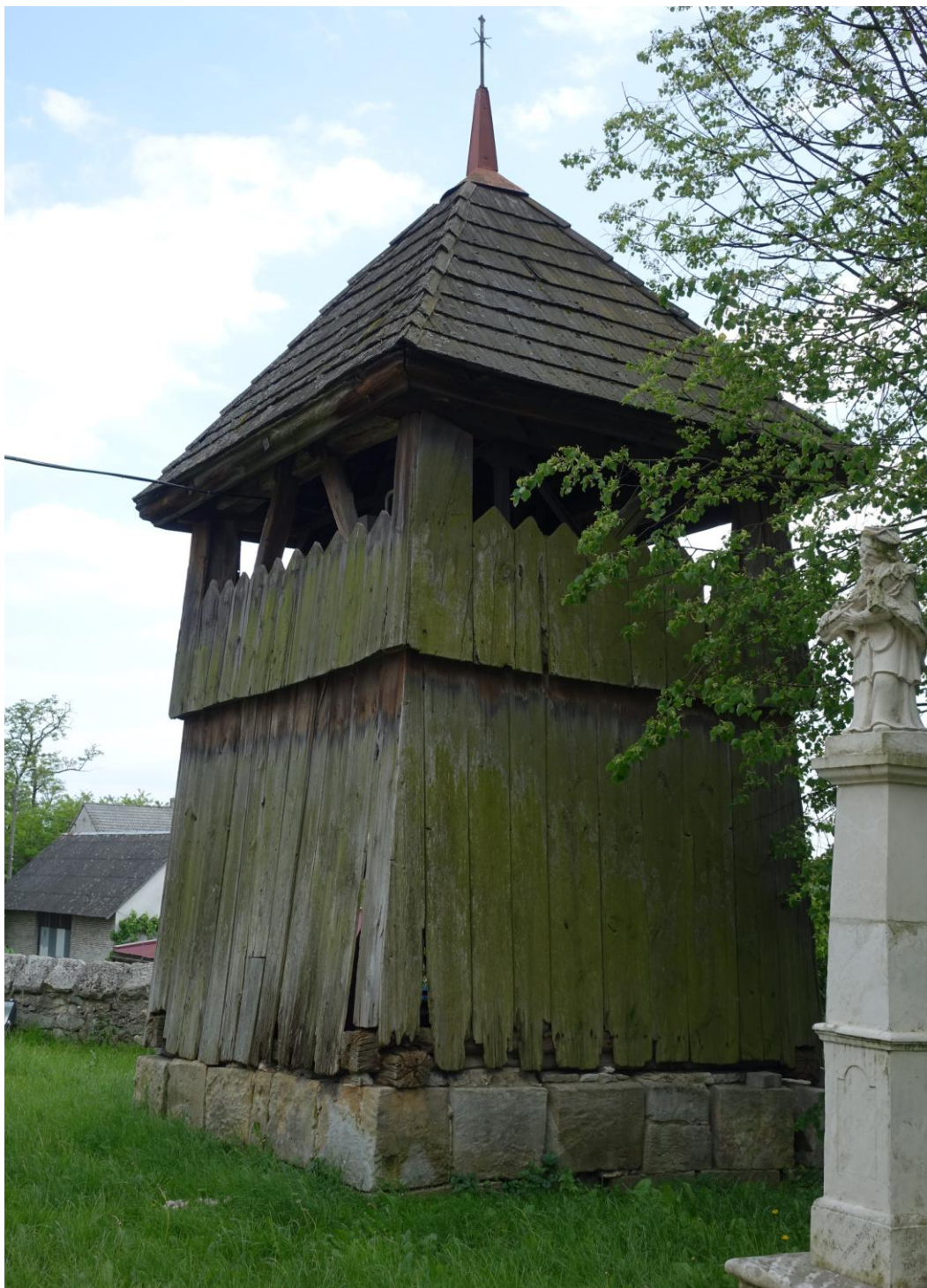
Zdjęcie 9. Drewniana dzwonnica z XVIII w. w Dobrowodzie.