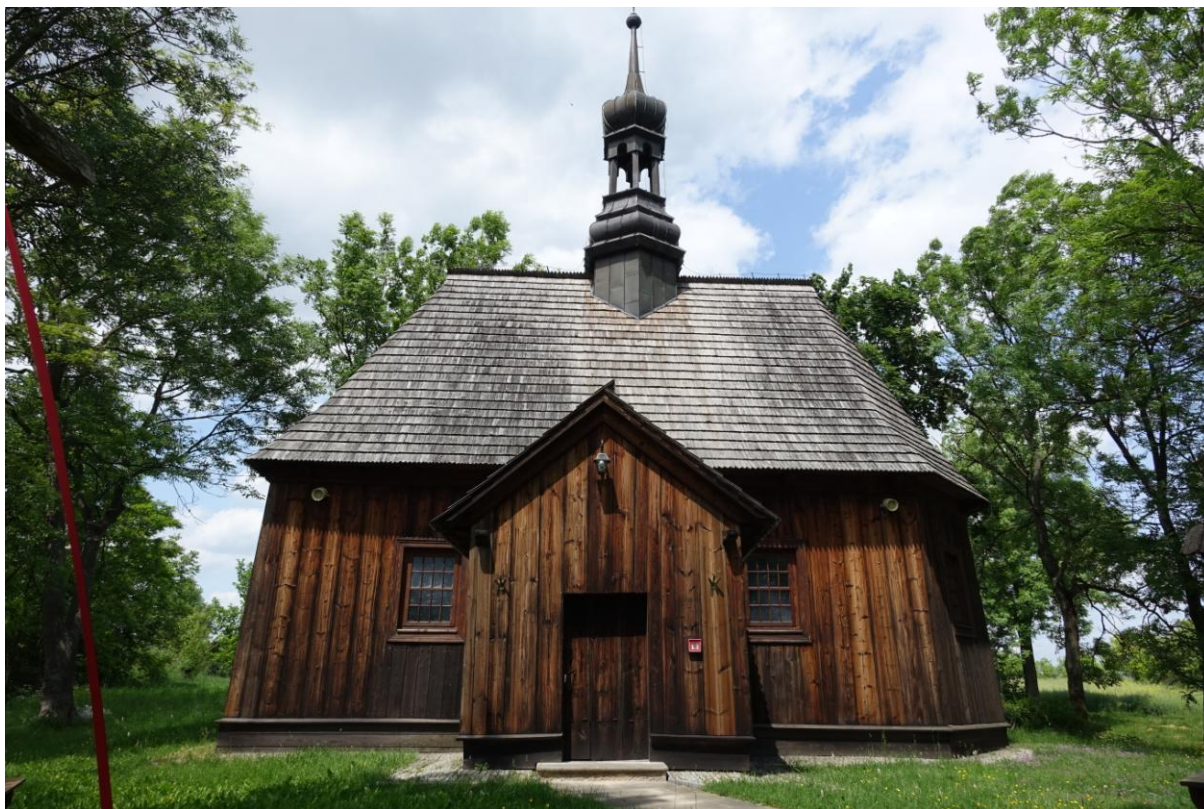
Zdjęcie 17. Drewniany kościół pw. św. Stanisława Biskupa w Chotelku.