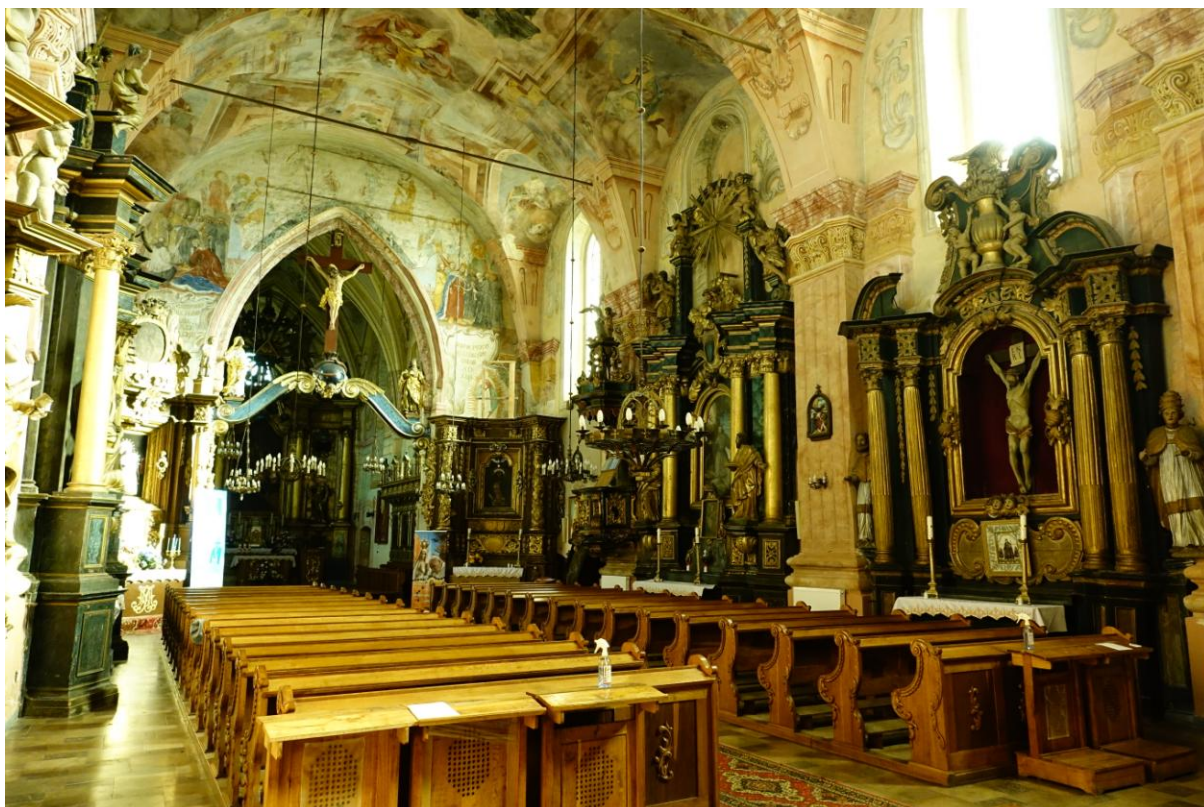
Zdjęcie 5. Wnętrze kościoła pw. św. Stanisława w Nowym Korczynie.