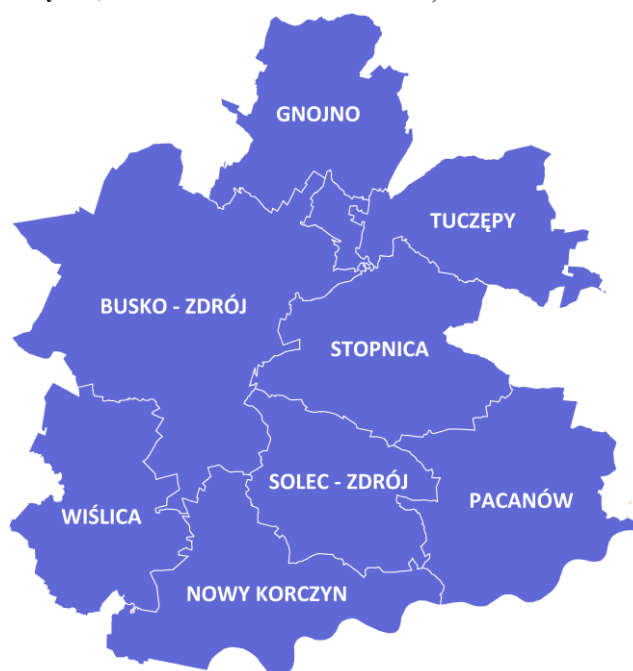
Rysunek 3. Poglądowa mapa Powiatu Buskiego.

Obszary chronionego krajobrazu w Powiecie Buskim obejmują część obszarów gmin: Busko - Zdrój, Solec - Zdrój, Nowy Korczyn, Stopnica, Pacanów i Wiślica - są to: Chmielnicko - Szydłowski, Solecko - Pacanowski, Nadnidziański i Szaniecki Obszar Chronionego Krajobrazu. W Powiecie Buskim znajdują się także rezerwat przyrody (rezerwat słonorośliny w Owczarach) oraz rezerваты stepowe (Góry Wschodnie, Przęślin, Skorocice i Skotniki Górne).