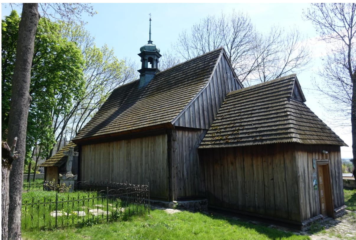
Zdjęcie 16. Drewniany kościół pw. św. Leonarda w Busku – Zdroju.