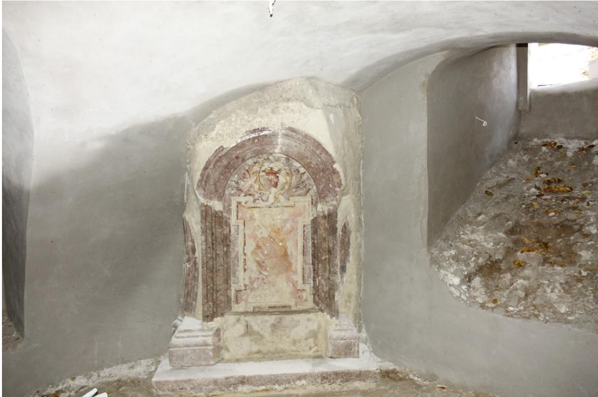
Zdjęcie 15. Krypta znajdująca się pod kaplicą św. Anny – pozostałość po kościele klasztorным w Kątach Starych.