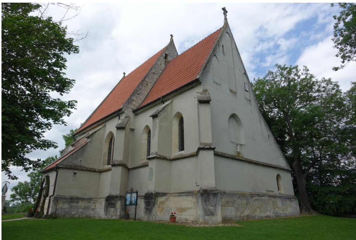
Zdjęcie 7. Gotycki kościół pw. św. Bartłomieja w Chotlu Czerwonym.