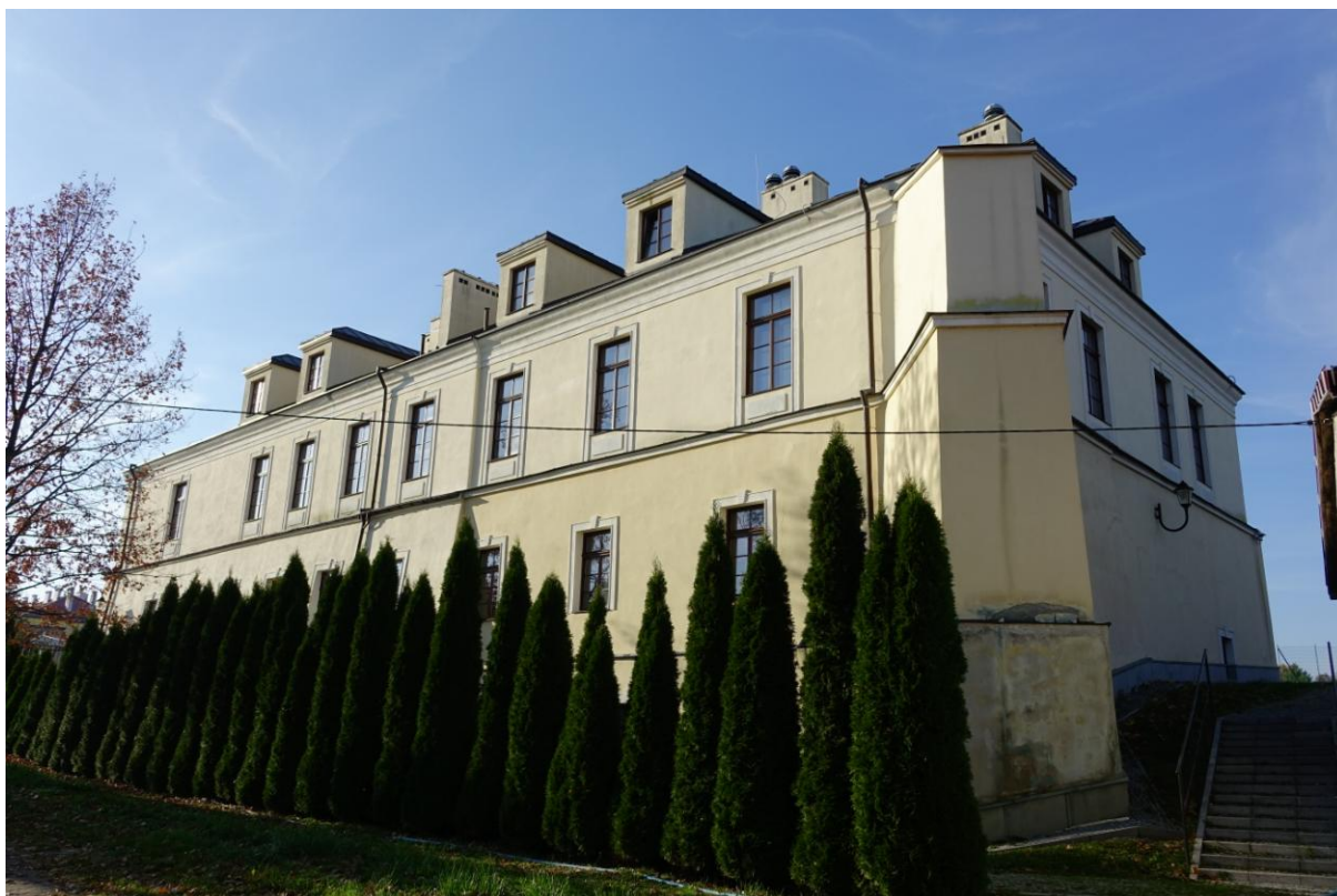
Zdjęcie 19. Zamek w Stopnicy – widok współczesny.