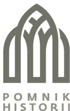
Rysunek 1. Wzór logo „pomnik historii”.

W celu wyróżnienia pomnika historii jako marki i ułatwienia działań promocyjnych, w 2011 roku Narodowy Instytut Dziedzictwa opracował logo, zaakceptowane zostało przez Ministra Kultury i Dziedzictwa Narodowego Logiem pomników historii jest godło z motywem gotyckiego łuku, dostępne jest ono w kilku wersjach kolorystycznych. Szczegółowe informacje dotyczące warunków korzystania z logo „pomnik historii” dostępne są na stronie internetowej NID pod adresem: https://nid.pl/pomniki-historii .