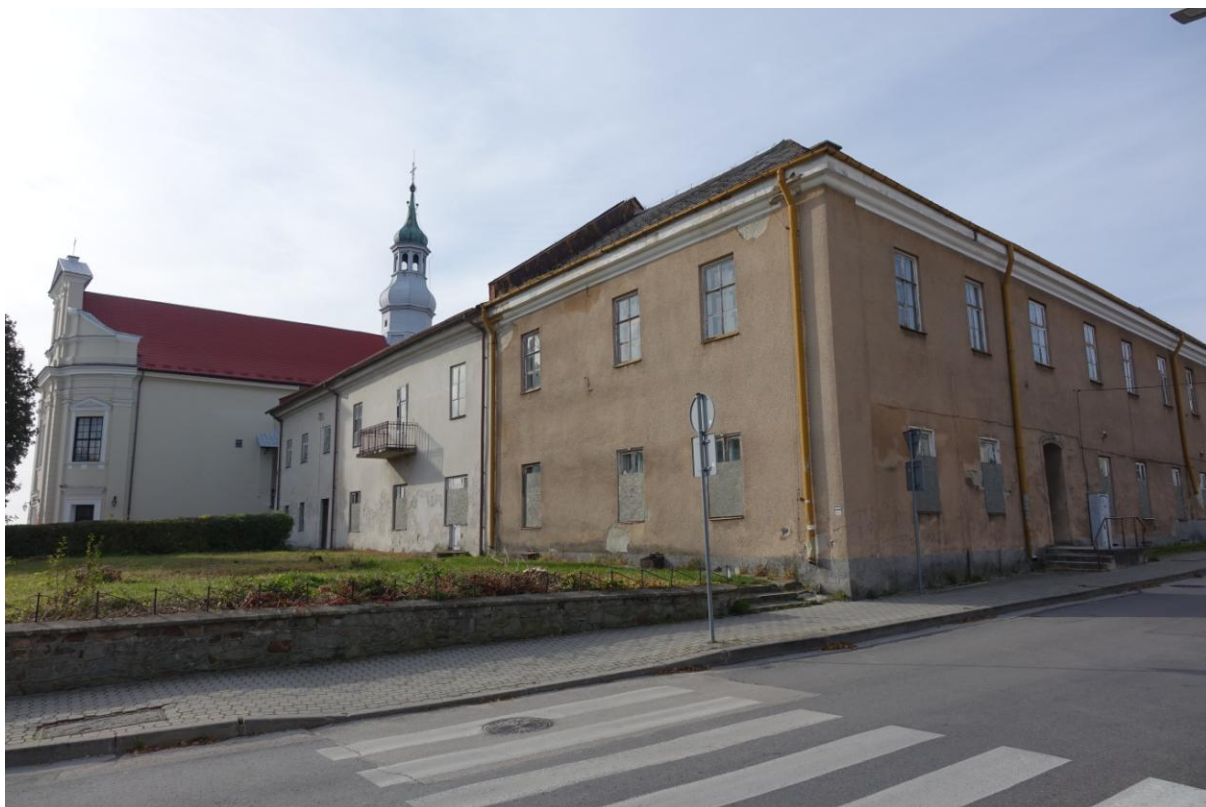
Zdjęcie 12. Ponorbertański zespół klasztorny w Busku - Zdroju.