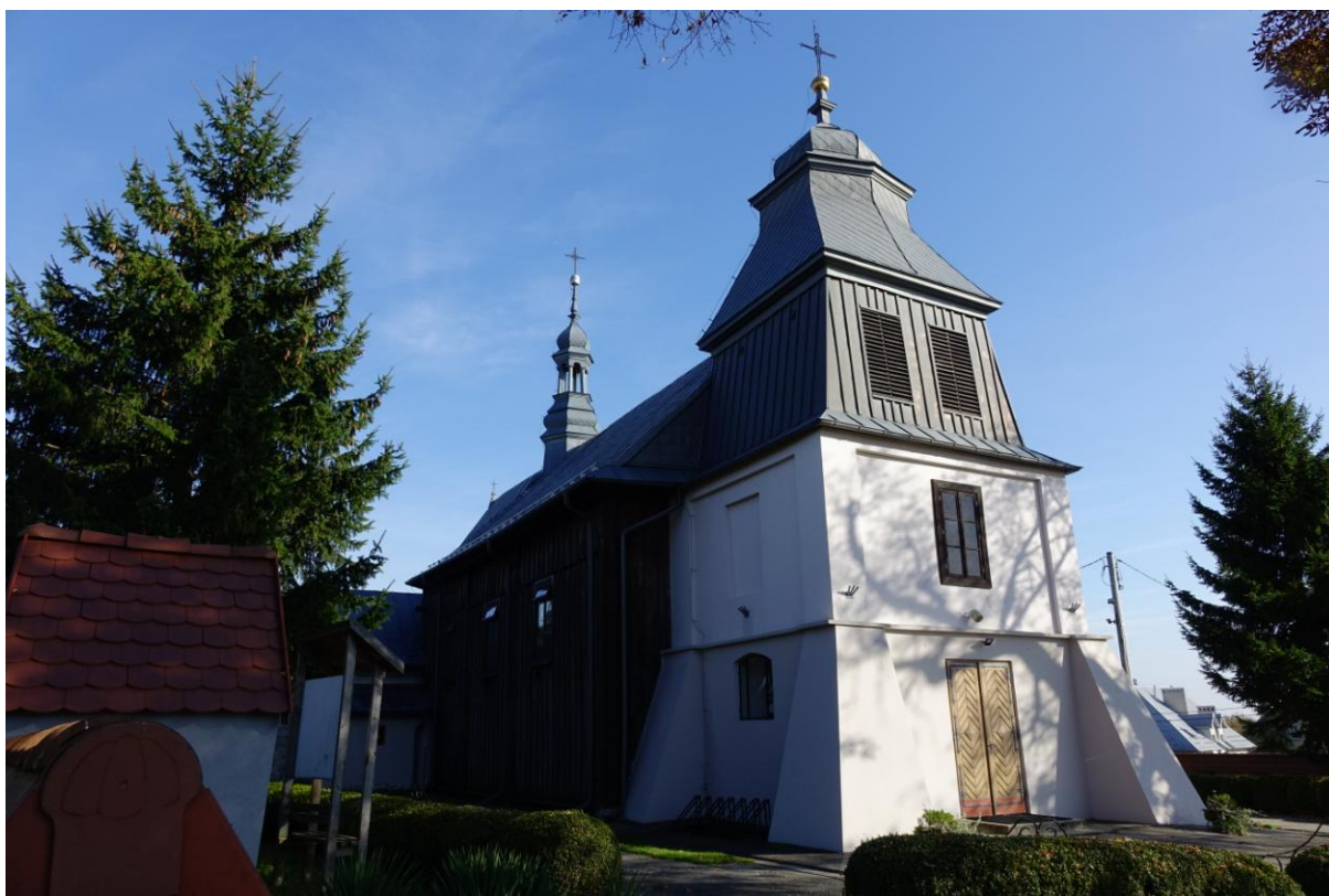
Zdjęcie 18. Drewniany kościół pw. św. Stanisława Biskupa Męczennika w Świniarach.