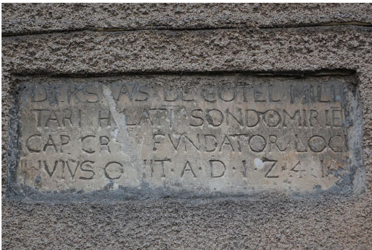
Zdjęcie 13. Tablica wmurowana w północną ścianę budynku poklasztorneho odnaleziona w XIX w. z inskrypcją po łacenie: „ Derslaw Chotel militari Palatinus Sandomiriac Capitaneus Cracoviencis fundator loci huius obit anno Domini 1241 ”, co w wolnym przekładzie znaczy: Deresław z Chotla, rycerz, palatyn sandomierski, kasztelan krakowski, fundator tego miasta, zmarł roku Pańskiego 1241.