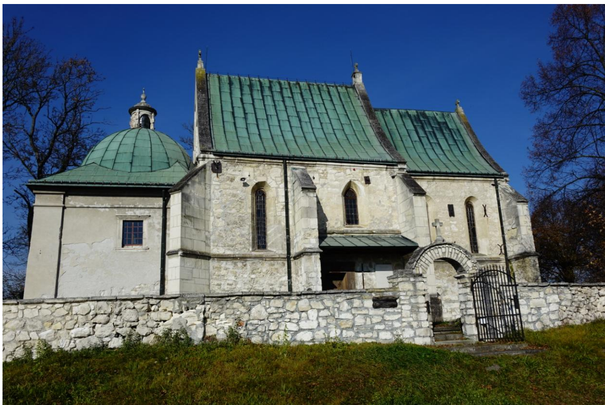
Zdjęcie 11. Kościół pw. św. Wawrzyńca diakona i męczennika w Gorzysławicach.

14) Zespół kościoła parafialnego pw. św. Jakuba Starszego Apostoła w Szczaworyżu , nr rejestru: A 40/1-2, data wpisu 02.04.2008, w skład którego wchodzi: