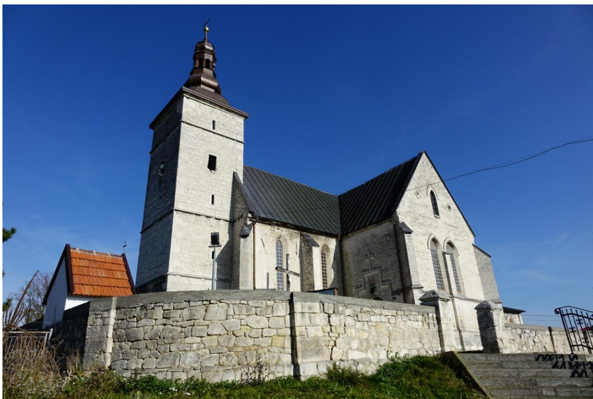
Zdjęcie 10. Kościół pw. Wniebowzięcia Najświętszej Marii Panny w Strożyskach.