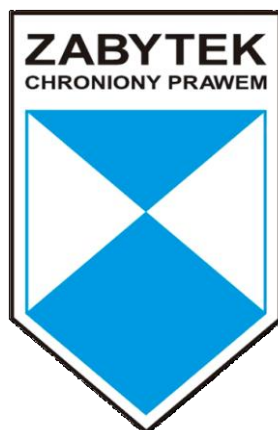
Rysunek 2. Wzór znaku „zabytek chroniony prawem”.

Na podstawie art. 12 ustawy starosta, w uzgodnieniu z wojewódzkim konserwatorem zabytków, może umieszczać na zabytku nieruchomym wpisanym do rejestru znak informujący o tym, iż zabytek ten podlega ochronie. Wzór i wymiary znaku określa Rozporządzenie Ministra Kultury z dnia 9 lutego 2004 r. ( Dz. U. 2004 Nr 30 poz. 259 ). Powinien on być wykonany z blachy w kształcie pięciokątnej tarczy o wymiarach 185 mm x 100 mm. Tarcza skierowana winna być ostrzem w dół, a w jej polu – prócz znaku Błękitnej Tarczy zgodnej z Konwencją Haską z 1954 r. – w jej górnej części zamieszczony powinien być napis „Zabytek chroniony prawem”.