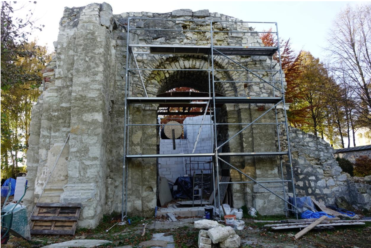
Zdjęcie 14. Odbudowa kaplicy św. Anny - pozostałość po kościele klasztornym w Kątach Starych..

16) Zespół klasztorny Księży Sercanów (dawniej oo. Reformatów) w Kątach Starych – wpisany pod numerem A.73/1-4 z 16.10.1956 i z 23.06.1967. Ufundowany przez Krzysztofa i Zofię Ossolińskich, wybudowany w 1639 r. Ojcowie reformaci zostali wprowadzeni do klasztoru w 1648 r. W 1672 r. w jego murach pochowano matkę Jana Chryzostoma Paska. Prawdopodobnie sam Jan Chryzostom Pasek spoczął tu w 1701 r. Kościół klasztorny został niemal doszczętnie zniszczony przez Niemców w dniu 7 listopada 1944 r. Niestety nie odbudowano dawnego kościoła pod wezwaniem św. Marii Magdaleny i Franciszka. Zachowały się z niego fragmenty murów przejścia z nawy do kaplicy św. Anny, pozostałości piwnic i resztki fasady. Obecnie podejmowane są działania w celu odbudowania kaplicy bocznej św. Anny z dawnego kościoła klasztornego. Istniejący kościół powstał po przebudowaniu jednego ze skrzydeł klasztornych. Do wnętrza zespołu prowadzi barokowa brama. Na murze dziedzińca umieszczono epitafium ze zniszczonego kościoła. W 1979 r. klasztor został przekazany księżom Sercanom.