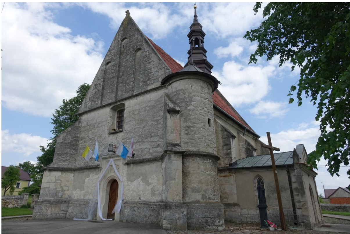
Zdjęcie 8. Kościół pw. św Marii Magdaleny w Dobrowdzie.