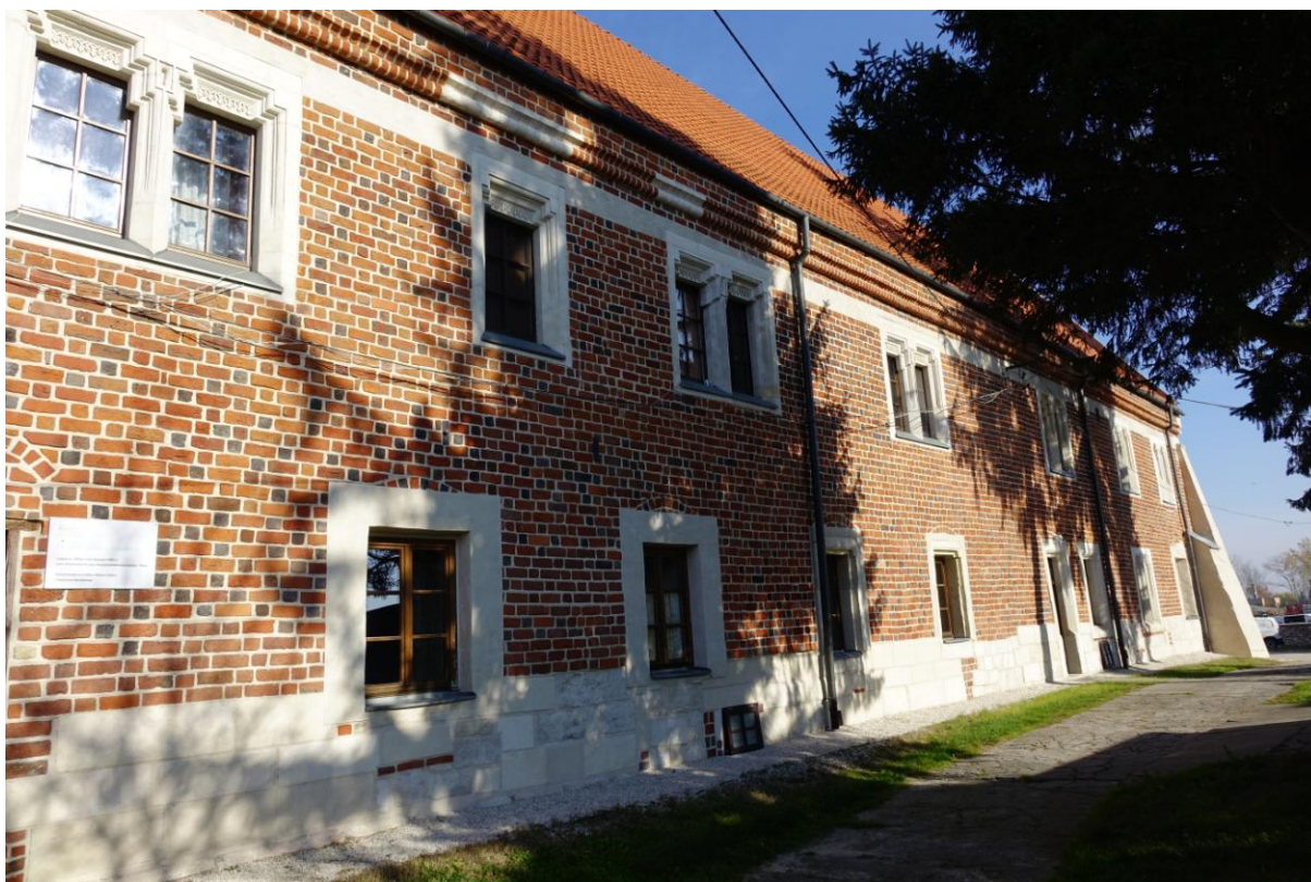
Zdjęcie 3. Dom Długosza w Wiślicy.