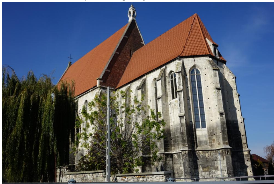
Zdjęcie 1. Bazylika kolegiacka Narodzenia Najświętszej Marii Panny w Wiślicy – widok od strony prezbiterium.