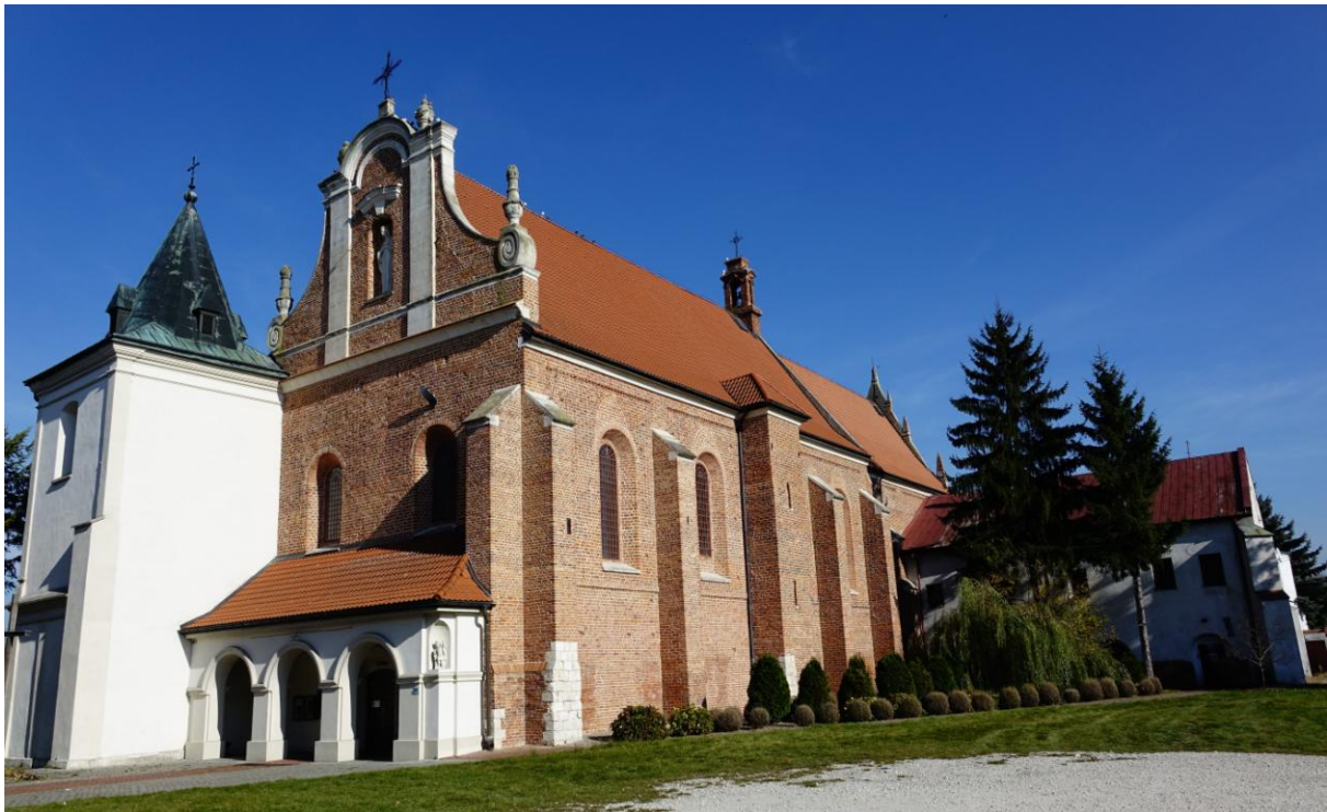
Zdjęcie 4. Kościół pw. św. Stanisława w Nowym Korczynie z widocznym skrzydłem poklasztorным przylegającym do prezbiterium kościoła.